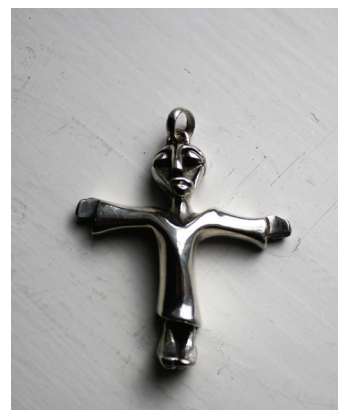
Nis Schmidt: Smykker: envinget engel og krucifiks